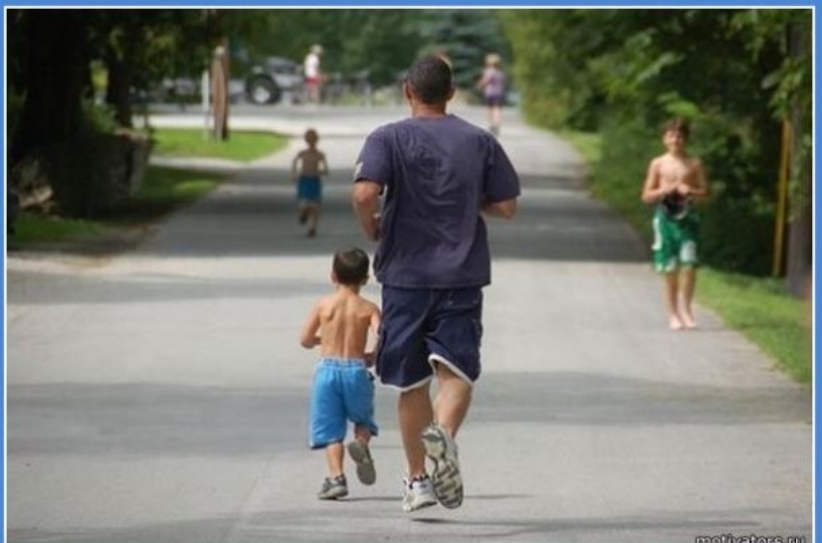
Только своим личным примером мы дадим нашим детям правильное воспитание!

Да, я папа этого ШумНОГО ребенка. Он у меня не мерзнет. И ему не жарко. Я оплачу все, что он разобьёт или съест. Не угощайте его ничем, пожалуйста! Я сам его накормлю, когда будет нужно. Я умею с ним обращаться не волнуйтесь!