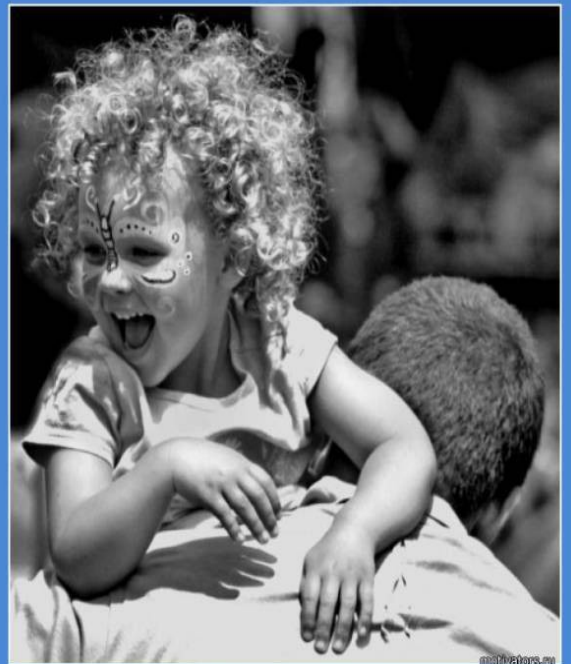
Самый главный вклад в воспитании ребенка - правильно подобранный папа :)