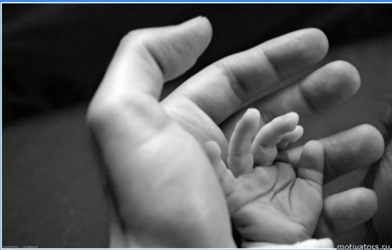
тебе доверили самое ценное ЖИЗНЬ. Она очень хрупкая. Не сломай её